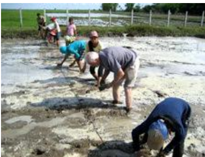
Repiquage du riz