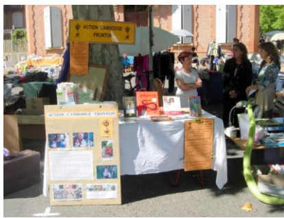
Stand A.C.F au vide-grenier de Fronton